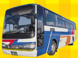
北海道北見バス株式会社