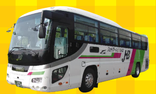
JTB ジェイ・アール北海道バス