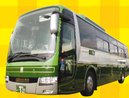
道南バス株式会社