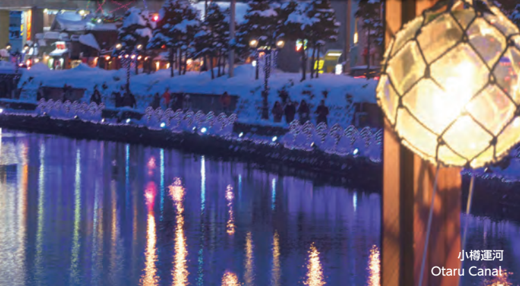
小樽運河 Otaru Canal