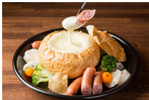
バインフォンデュ (2 人前) ¥2,350

リニューアルにあたり、パンの器が印象的な「バインフォンデュ」など、これまで評判を博していた人気メニューもブラッシュアップ。食材はもちろん彩りにも気を配り、よりワインに合うよう洗練を加えました。また、北海道の四季が感じられる季節の限定メニューも登場します。シェフが腕によりをかけた美食を、道産ワインとともにぜひご賞味ください。