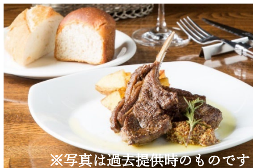
※写真は過去提供時のものです

パンの器の中に、とろりチーズがたっぷりに入った小樽バインの定番メニュー。チーズは白ワインで溶いており、とっっても風味豊かで具材とよく絡みます。器のパンまで食べられるのでボリュームも満点。もちろん、ワインとの相性も抜群です。