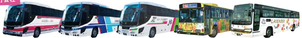
札幌～旭川 / 札幌～富良野 [北海道中央バス]