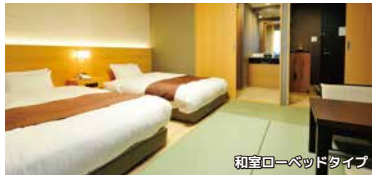
和室ローベッドタイプ