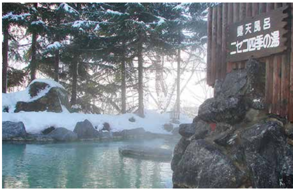
露天風呂 ニセコ四季の湯