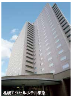
ホテルルートイン札幌中央 ホテルグレイスリー札幌 ホテルネッツ札幌 札幌エクセルホテル東急