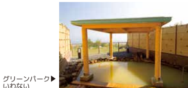
グリーンパーク▶ いわない